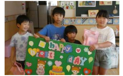
おたんじょう会は先生たちの手づくりおやつ♡