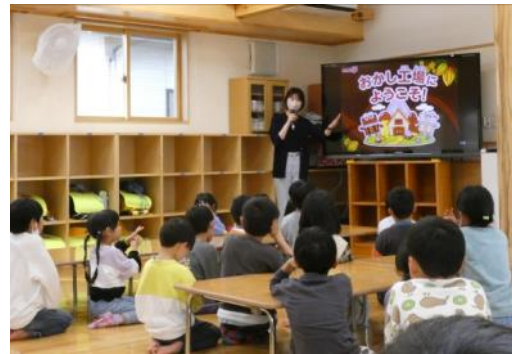
明治さんの万華鏡作り